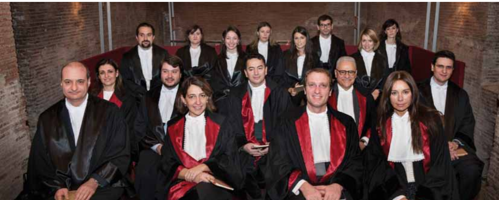
La squadra dei Docenti di ruolo di Universitas Mercatorum

In esito a ciascuna delle due lauree Triennali è possibile completare il percorso di studi con l'iscrizione alla Laurea Magistrale biennale in Management.